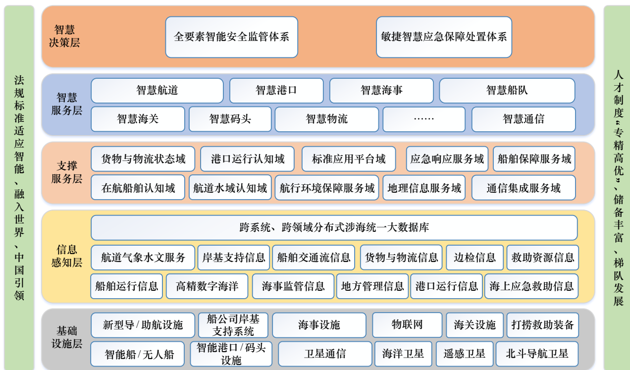
图2 上海市一体化航运安全保障智慧化管控“五层两面”架构