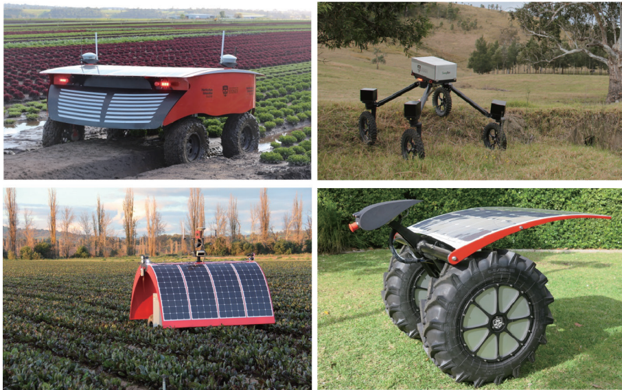
图2. 智能机器人在农业领域的应用。

任何种类的传感器都可能会出现故障，这可能是由天气或其他环境因素等多种情况所造成的。正如我们所熟知的，尽管相机可以获取优质的适宜分类的纹理信