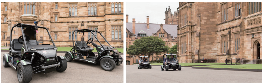
图3. 在大学校园内运行的AV电动汽车。