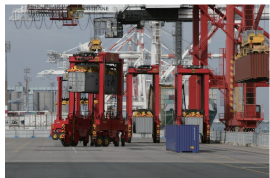
图1. 在澳大利亚布里斯班港口运行的全自动跨运车。

在野地机器人学中成功应用该技术需要确保机器始终处于受控状态，即使在某些部件出现故障时亦是如此。这需要开发基于各种不同模式传感器（如雷达和激光）的新传感技术。这些概念对于高完整性导航系统的开发至关重要[6,7]。该系统如参考文献[5]中所述，包