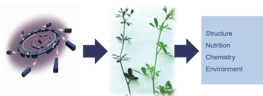
图1. 以先进的同步辐射技术为基础的生物分析技术能够同时提供四种类型的信息，包括组织结构、组织营养、组织化学、组织环境。

极少，而饲料的结构组成与动物营养的传递直接相关[15,16]。伴随其他因素（如营养素），饲料内在的分子结构和组成会影响饲料品质、营养价值和生物学功能及其在动物体内的发酵、降解动力学及消化过程[12,17]。饲料的分子构造和组成强烈地影响蛋白质在小肠内的吸收率，并且影响蛋白质与动物消化道内源消化酶的接触[18,19]。蛋白质与消化酶接触的减少会导致蛋白质消化和吸收率下降，从而降低其对动物的营养价值[20-22]。