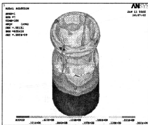
图 1 胀套等效应力

在随后的年代, 计算机用于工程技术领域也有很大的发展, 从 CAD, CAM 到 CAE, 在产品研制开发的每个阶段都有应用。有限元方法在复杂的机械结构分析方面是一个重要的工具, 在固体力学和流体力学方面都可以应用。与产品方案设计阶段有关的优化设计方法, 得力于 CAD 和结构空间仿真, 结合力学分析可以有效地达到优化目标。在产品阶段, CAD 提供了有力的手段, 使零部件设计效率和质量大大提高。与环境因素有关的产品性能响应如力学强度、振动、冲击、温度复合等在计算机上的模拟试验可以在设计阶段早期预估产品环境响应的薄弱环节和性能变化, 减少试验产品投产数量和大型试验次数。图 1 为核反应堆零件胀套等效应力分布的计算机模拟图。