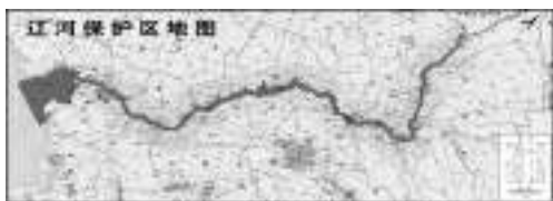
图1 辽河保护区地理位置图

宁省借鉴国外河流管理经验,划定辽河保护区,设立辽河保护区管理局,在保护区范围内统一依法行使环保、水利、国土资源、交通、农业、林业、海洋与渔业等部门的监督管理和行政执法职责以及保护区建设职责,体现了流域综合管理的理念。辽河保护区范围始于东西辽河交汇处(铁岭福德店),终于盘锦入海口。分布在东经121°41'~123°55.5',北纬40°47'~43°02'之间,面积为1 869.2 km 2 的区域(见图1)。辽河保护区划区设局,使辽河治理和保护工作由过去的多龙治水、分段管理、条块分割向统筹规划、集中治理、全面保护转变。为此,启动了辽河保护区治理与保护技术研究项目。