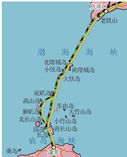
图2 渤海湾隧道方案总体布置平面图