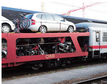
图3 列车托运方式示意图

渤海湾隧道拟采用单洞单线隧道+服务隧道+单洞单线隧道的模式,通过隧道的汽车及货物由火车托运(见图3),设计时速为250 km/h,高速和重载加剧了轮轨的动态作用,对运行安全性提出了更为严峻的考验。