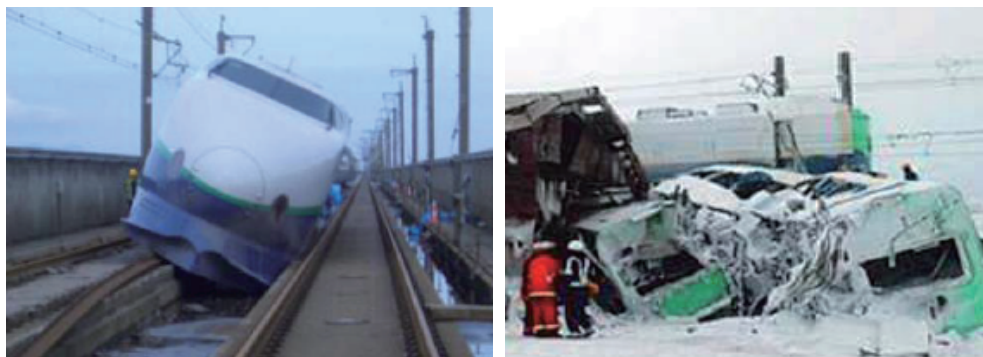
图 1 地震（左）和暴风雪（右）引起新干线高速列车脱轨 [2]

自世界第一条高速铁路开通运营以来，一代代科研技术人员虽然对高速铁路进行了不断探索，但