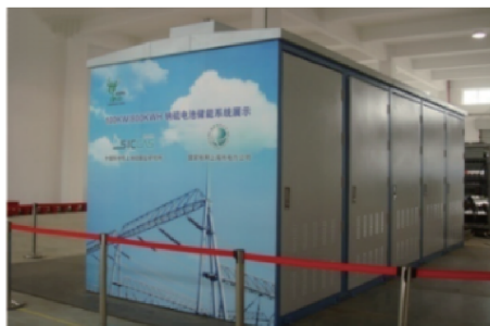
(c) 2010 年上海世界博览会上展示的 100 kW/800 kW 钠硫电池储能系统