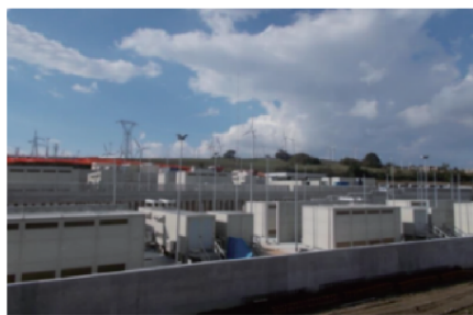
(b) 意大利南部高压电网的 34.8 MW 钠硫电池储能电站