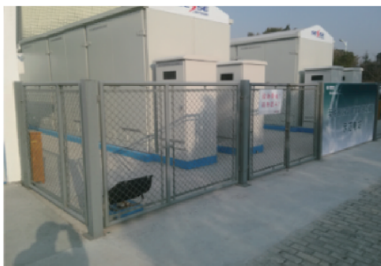
(d) 崇明岛风电场兆瓦时级的商业应用示范