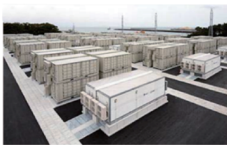
(a) 日本 50 MW/300 MWh 钠硫电池储能系统

项目，4 GWh 以上的钠硫电池储能系统 [10]。然而，2011 年 9 月，东京电力公司为三菱材料株式会社筑波厂安装的钠硫电池 (NGK 生产) 系统发生火灾，这一事件在一定程度上造成了业界对于钠硫电池安全性的担忧。其后，NGK 先对正在运行的钠硫电池电站的模组和系统进行安全隐患维护，并对新生产的电池在电芯层面和模块层面同时采取了多种提高安全保障的新措施 [12]。通过采取一系列应对举措后，从 2013 年开始，NGK 生产的钠硫电池在日本、阿联酋和欧洲等国家和地区持续有大型储能项目上线。2016 年 3 月，NGK 公司和九州电力株式会社共同推出的 50 MW/300 MWh 钠硫电池储能系统改善电力供需平衡的示范项目开始运行，是当时全球最大的大容量储能电站 (见图 1a) [10]。2019 年，NGK 在阿布扎比酋长国完成的一个项目使用了 108 MW/648 MWh 的钠硫电池储能系统，持续放电时间达 6 h。图 1b 显示的是应用于意大利南部高压电网的 34.8 MW 钠硫电池储能电站的局部照片 [12]。在意大利，钠硫电池的电芯和模块经过了严谨的风险评估，包括内源性短路和外源性火灾、地震、洪水、直接和间接闪电、蓄意破坏、高空坠落等滥用场景。评估结果显示，经