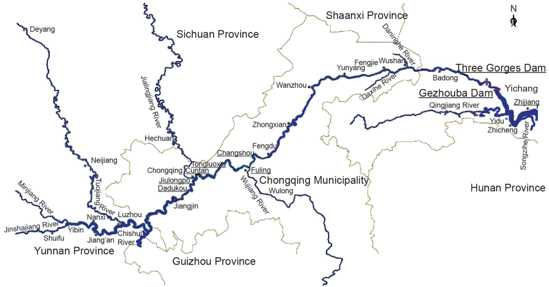
图2. 三峡大坝上游长江干流及主要支流。

民搬迁安置55.07万人(包括外迁19.62万人)。迁建城市2座、县城10座、集镇106座,搬迁安置74.57万人(含工矿企业搬迁人口),迁建区面积为 7.14273 \times 10^7 \text{ m}^2 。完成文物古迹保护项目1128处,其中地面文物364处、地下文物764处,发掘面积为 1.7538 \times 10^6 \text{ m}^2 。一批国家级重点文物得到恢复和保护,保存了大量实物资料。移民安置区公路、桥梁、港口、码头、水利及电力设施、电信线路、广播电视等专项设施迁(复)建任务全部完成。移民搬迁后的居住条件、基础设施和公共服务设施明显改善;移民生产安置措施得到落实,生产扶持措施已见成效,移民生活水平逐步提高,充分体现了“以人为本、关注民生、保护环境、持续发展”的库区移民安置规划理念,促进了库区经济发展与环境保护的良性循环,保障移民搬迁安置和库区经济社会发展需要,并经受了175 m水位运行的检验,库区社会总体和谐稳定。