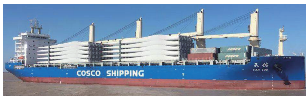
图1 我国冰级 3.6 \times 10^4 t 多用途船“天祐轮”在北极航线航行

目前，我国仅在南极冰盖底部结构、北极海洋酸化、极区空间环境等少数前沿领域取得突破，在