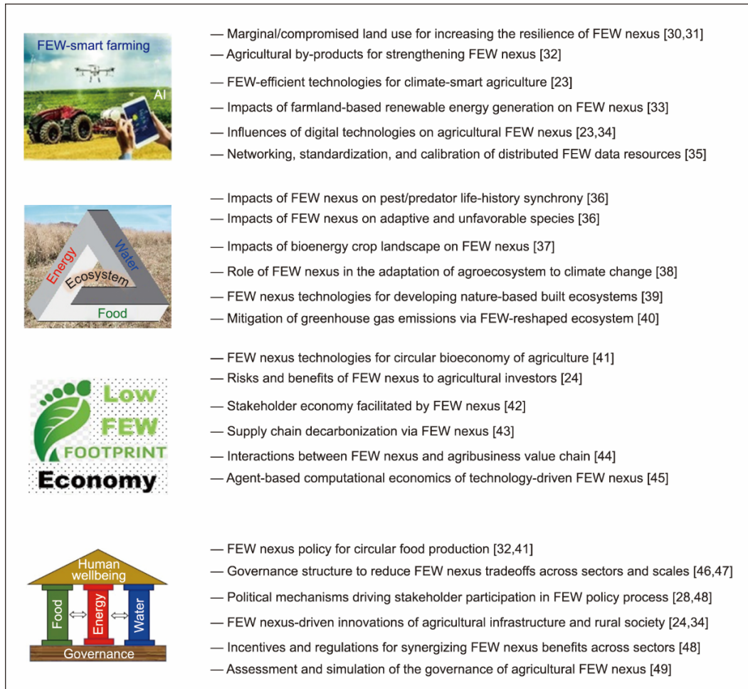
图1. 农业FEW关系议程中的研究差距。