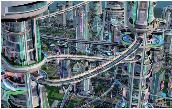
图4. 面临全新3D地图绘制挑战的未来智能城市[19]。

车上配备的高级驾驶辅助系统(ADAS), 可以让乘客在高速公路上拥有几秒钟的自动驾驶体验。这种功能的基础是能够扫描车周围环境的光学和雷达传感器, 将这些扫描数据输入到操控、加速和刹车制动器, 可保障汽车在低复杂性的情形下进行自动驾驶。这是实现自动驾驶的第一步。当转入到城市交通环境中时, 这些传感器所获取的信息就不足以满足完全自动驾驶的需求了。这就需要获取准确的车辆位置、速度和方向以及当前交通状况和其他交通参与者的行为等数据。这种多维信息的基础参照就是精确度为 \pm 10\text{ cm} 的高清地图。通过更新, 高清地图能够被增强至扫描更大范围(约 1\text{ km} 范围内)的车周环境的实时状况。因此, 高清地图是汽车工业面临的一项重要挑战, 特别是因为这个主题直到现在还一直没有被当成是汽车制造企业的核心竞争力。