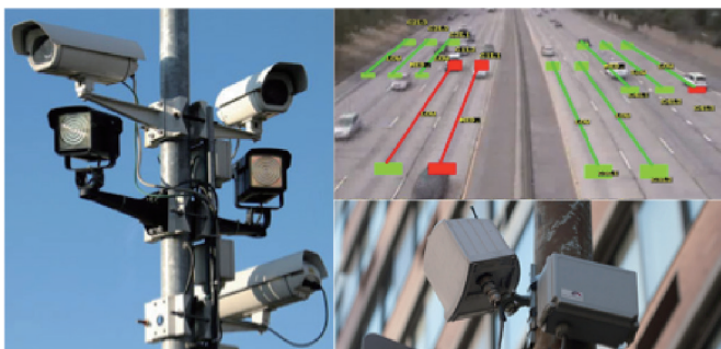
图2. 采集实时交通运行情况的数据并同车辆进行通信的路边设施。