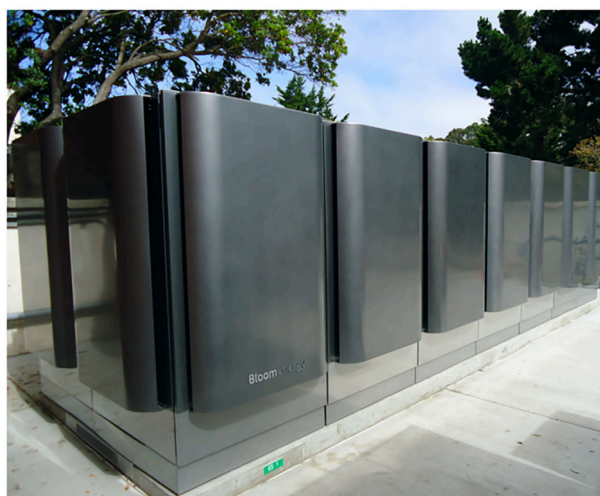
图1 BE公司固体氧化物燃料电池发电系统

日本在新能源产业技术综合开发机构（NEDO）的领导下，固体氧化物燃料电池规划主要包括家用型（千瓦级）以及电厂型（兆瓦级及以上）等，日本从2005年开始启动家用燃料电池热电联供（ENE-FARM）计划，对ENE-FARM进行示范运行及政府补助，因此目前以家用小型热电联供系统最