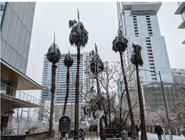
图2. 暴风雪期间，美国得克萨斯州奥斯汀市的气温降至零下14℃，降雪量超过16 cm。2021年2月17日，冰雪覆盖了奥斯汀市中心的一些棕榈树。

2021年的这场暴风雪并非得克萨斯州有史以来最冷的一次，但它对该州的影响范围更广，持续时间更长，温度比2011年寒潮期时的还低（图2），引发了前所未有的冬季电力需求激增[12]。在得克萨斯州居民打开加热器开始取暖时，却有越来越多的电源在关闭。大约50%的风力涡轮机结冰了[13]。得克萨斯州的4个核反应堆中的一个也停止了发电（由于气温低，抽水机停止工作）[14]。一些燃煤发电厂的煤冻住了，无法使用[15]。与2011年一样，为该州提供约50%电力的天然气发电厂也出现了问题[10]。极寒的天气再次扰乱了天然气的生产和输送[10]，并导致一些工厂中的设备出现故障[16]。Rhodes说道：“我们的电网需要创纪录的发电量，而我们却失去了约一半的发电能力。”