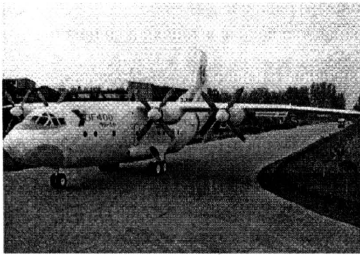
图 3 Y-8 运输机