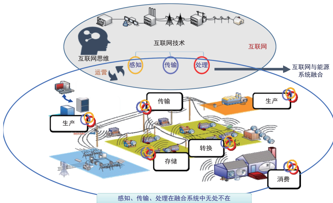
图 1 能源系统与互联网融合示意图

具体来看,实现智能化阶段的关键路径在于推进互联网中大数据技术在能源系统中的应用,以能源大数据来提升能源系统的智能化水平。在能源的生产侧,基于大数据技术,整合气象、地理、环境、能源等多维度信息,可实现可再生能源功率的精准预测,实现可再生能源的高比例消纳,减少弃风、弃光现象,同时为能源结构的优化提供支持。能源消费侧重视智能电表、智能能源表计的推广应用,