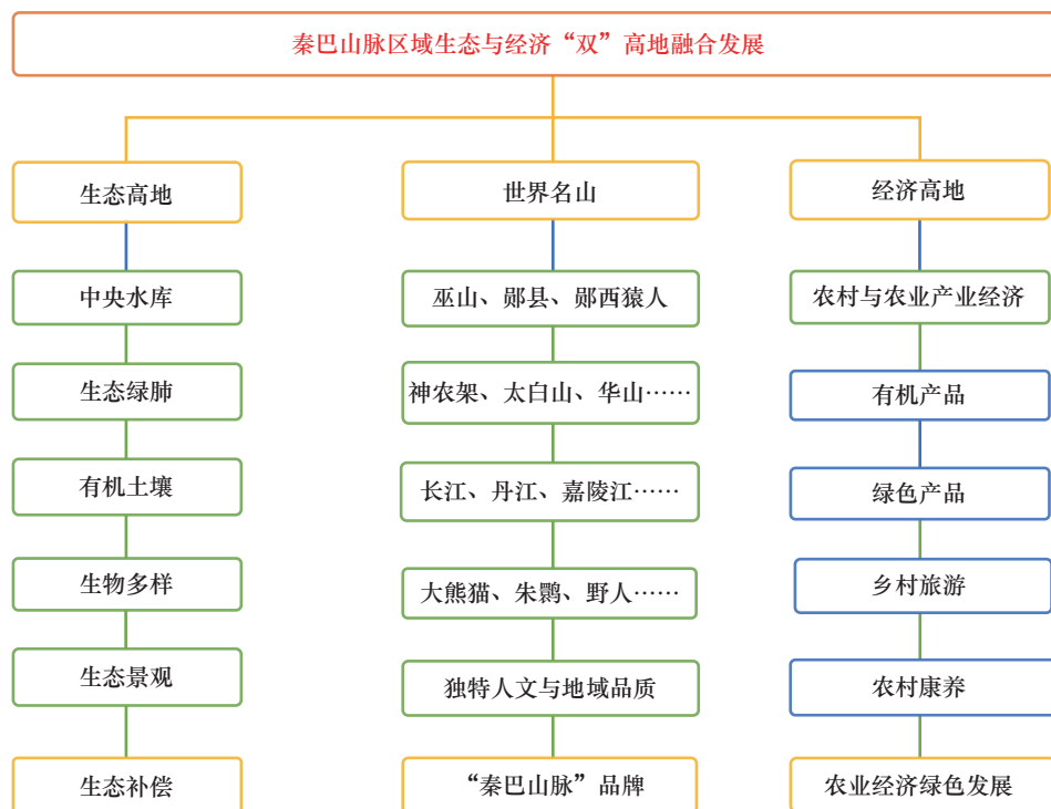
图2 秦巴山脉区域生态与经济“双”高地融合发展示意图

中国工程科技论坛第一届秦巴论坛已于2016年9月在陕西西安成功召开，聚焦区域绿色循环发展主题，指明可持续发展方向，达成了秦巴山脉是我国“中央水库”与“国家绿肺”，是国家生态安全命脉等重要共识。第二届秦巴论坛于2019年10月在河南南阳举行，进一步巩固和深化秦巴山脉区域绿色循环发展研究主题。建议在秦巴论坛大主题下，