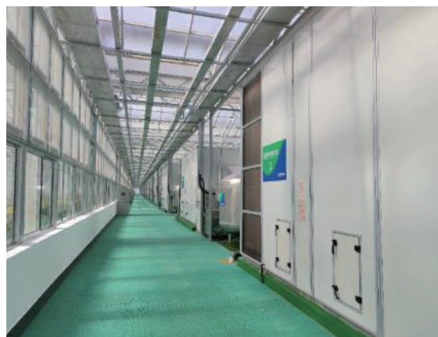
图2 基于正压通风的温室环境综合调控系统

未来智能化作业装备技术将着力突破无人操控条件下的作物生产、采后、物流等环节的关键技术，