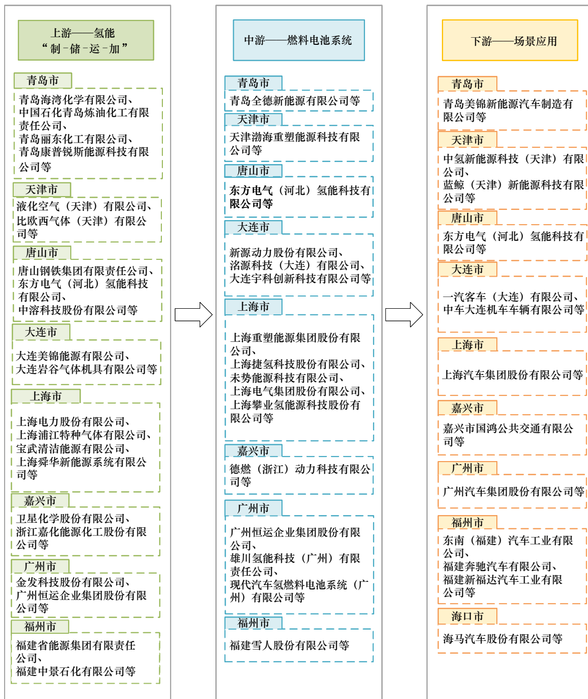
图1 我国部分港口城市的涉氢企业