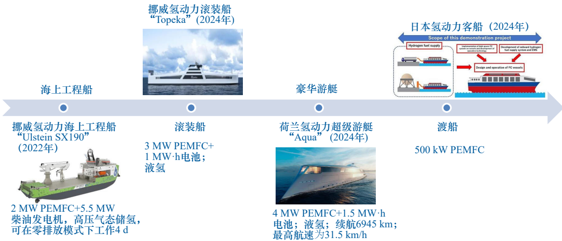
(b) 国外计划研制的氢动力船舶