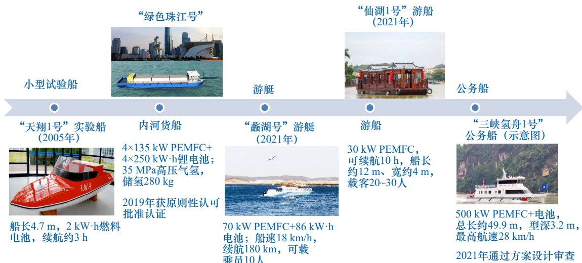
(c) 我国氢动力船舶产品情况 (部分)