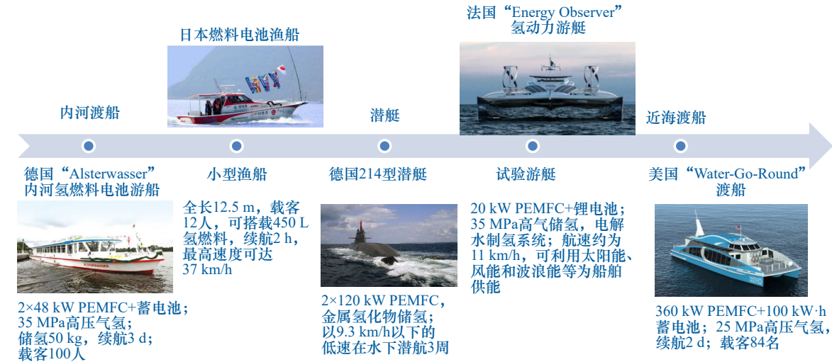
(a) 国外已下水的氢动力船舶