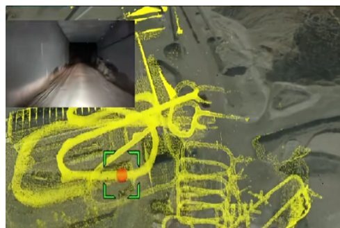
图3 芬兰 Callio FutureMINE 深地技术试验场