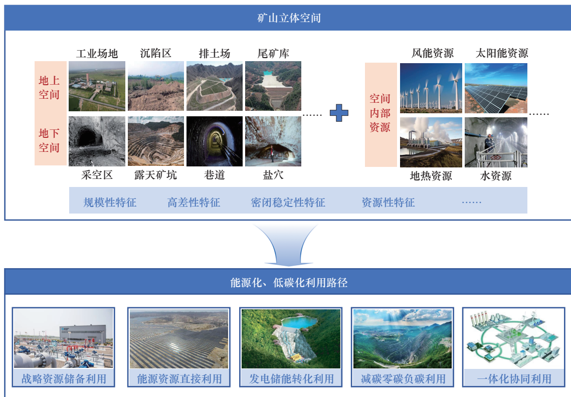
图2 矿山立体空间能源化、低碳化利用路径